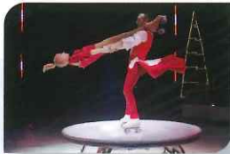
The Crystal Wheels