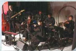
Pasona音楽島プロジェクト