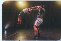
Duo 1 uno