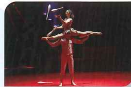
Duo One Heart