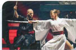
BLADE OF SHADOW