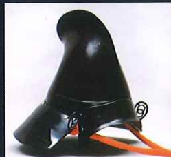
黒塗烏帽子形兜 たつの市立龍野歴史文化資料館蔵