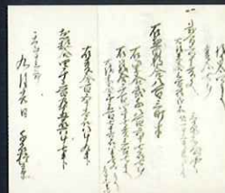
淡路国指図寄紙