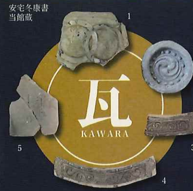
1. 輪進い紋瓦 2. 巴文軒丸瓦 3. 4. 唐草文軒平瓦 5. 文字瓦 / 当館蔵