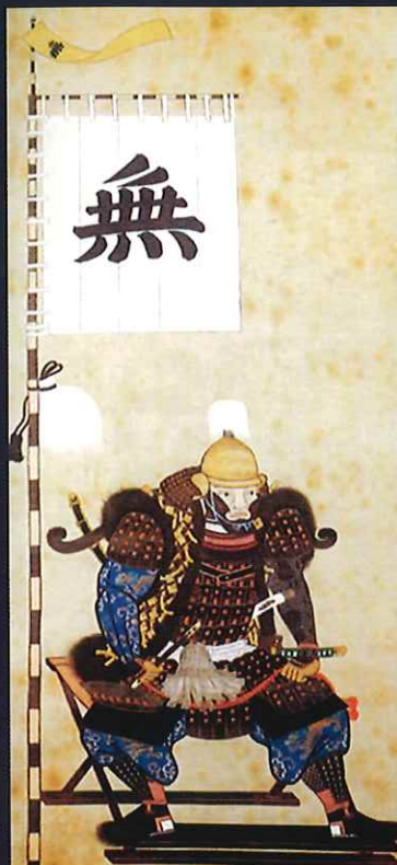
円覚公御画像(仙石秀久肖像)

今回の特別展では、歴代城主の貴重な資料や発掘調査で出土した瓦など、洲本城 500 年の歴史を余すことなくご覧ください。