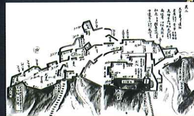
洲本城縄張り図(「味地草」より) 当館蔵