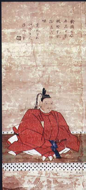
脇坂安治画像 個人蔵