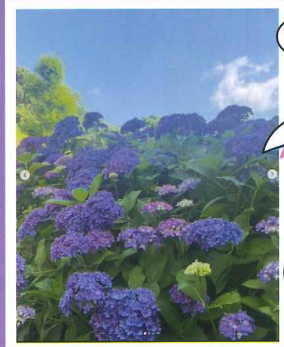
過去4年間のフォトコンテストで受賞されたお写真の一部です