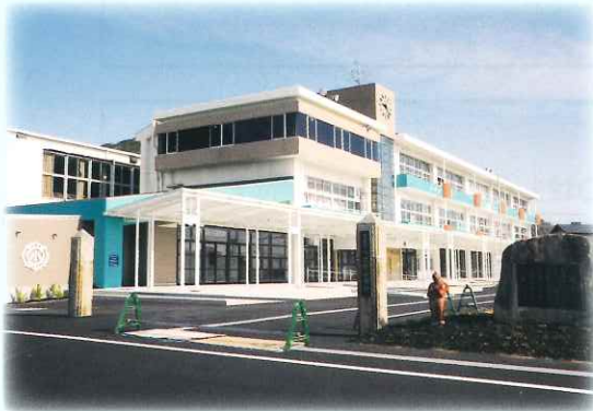
▲ 廃校となった小学校をリノベーションした「さの小テラス」