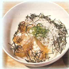
▲ 淡路島のしらすを使った料理 (イメージ)