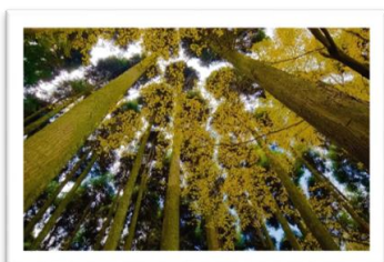
花の札所部門 優秀賞 作品名「空中黄葉」