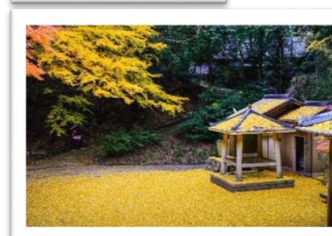
花の札所部門 優秀賞 作品名「黄色い絨毯」