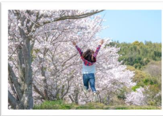
人・花部門 優秀賞 作品名「旅立ちの春にジャンプ！」