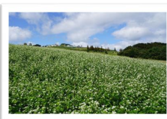
花の札所部門 優秀賞 作品名「白い絨毯」