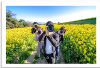
人・花部門 優秀賞 作品名「ONE TEAM」