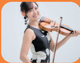
ヴァイオリニスト